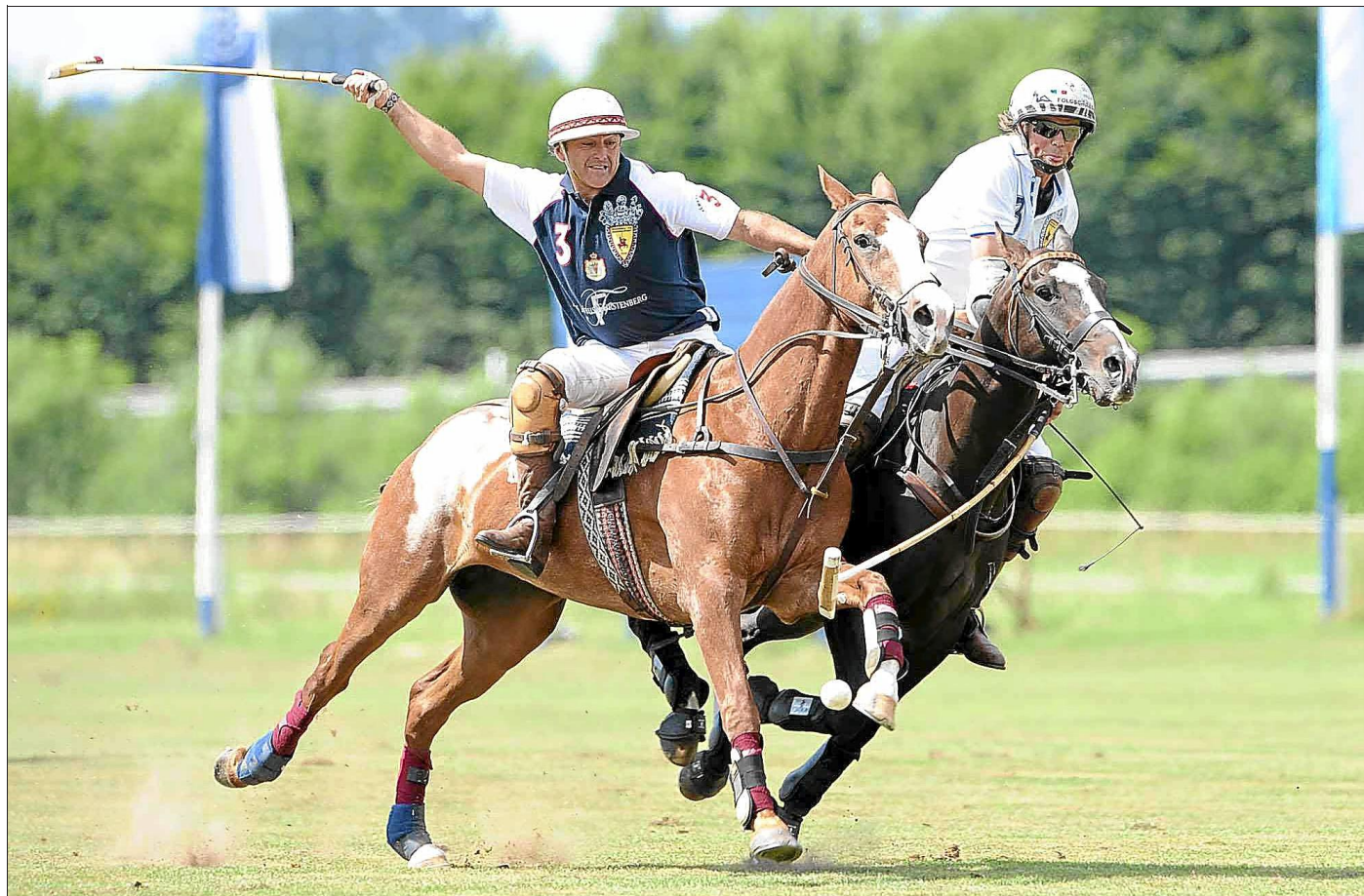
Packende Turnierwettkämpfe um Goals auf dem grünen Rasen im Schlosspark bietet sind beim Polo Cup im Juli angesagt.

Sponsor des Turniers ist die Berenberg Bank mit Hauptsitz