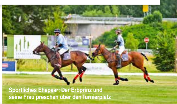
Sportliches Ehepaar: Der Erbprinz und seine Frau preschen über den Turnierplatz