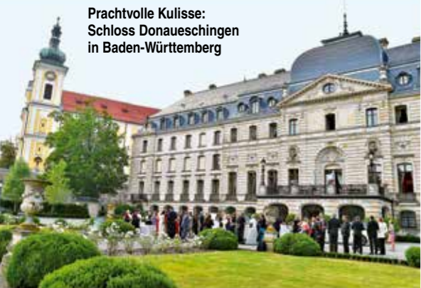
Prachtvolle Kulisse: Schloss Donaueschingen in Baden-Württemberg